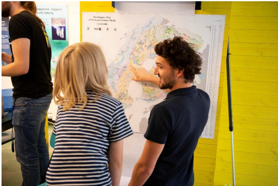
Figure 6: A RM@Schools ambassador explaining where to find mineral resources and critical raw materials in Sweden to the generation who will extract and use them in the future.