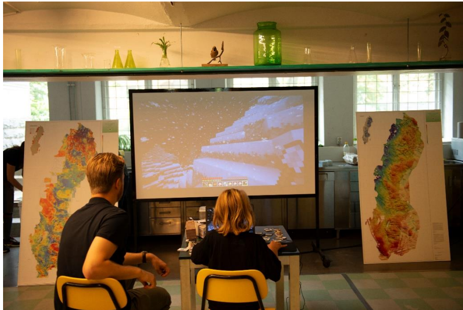
Figure 3: BetterGeo: a funny way to explore, mine, process and use mineral resources in a virtual world. On both sides of the screen, a magnetic and a gravity map of Sweden to introduce rocks properties and exploration methods to kids.