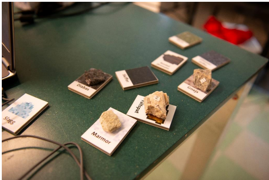
Figure 4: To connect the virtual world of BetterGeo with reality, rock and mineral samples are associated to their avatar in the game and exhibit around the computer.