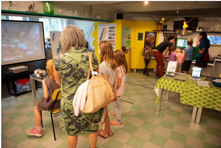
Figure 2: Our installation for geology day. To the left, the computer corner with BetterGeo: a geological modification of Minecraft that helps us raise kids awareness on mineral resources. To the right, the scientific corner with minerals, rocks and ores containing critical raw materials.